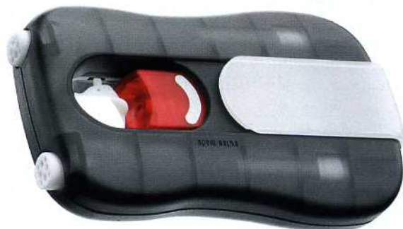
Das Taschengerät DS-201

Der "DS-201" ist gewissermaßen der kleinere Bruder des JPX. Es