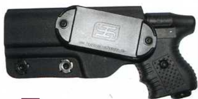
Spezial-Holster für den JPX

Nonletal ist umgezogen. Die neue Adresse lautet: Nonletal, Im Spring 6, 42489 Wülfrath.