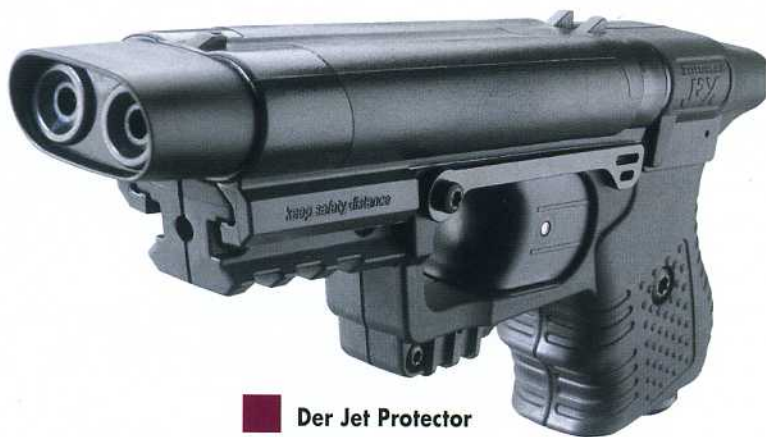
Der Jet Protector